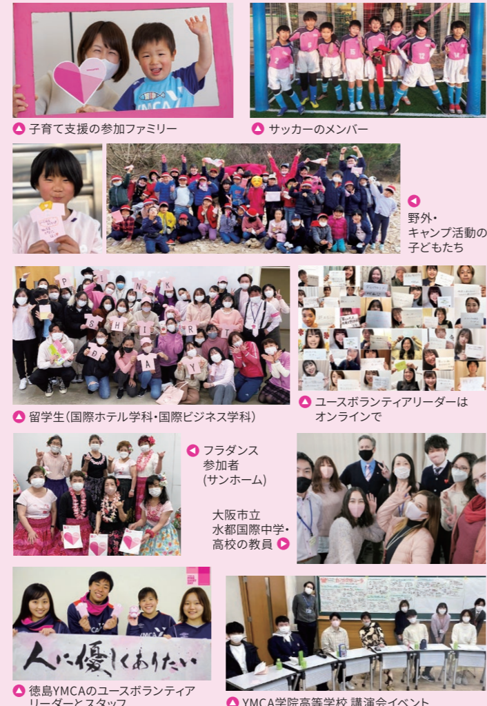
子育て支援の参加ファミリー

大阪YMCAの各拠点にて、幅広い世代のYボランティア・参加者の方々と共にいじめについて考え、発信しました。当日と実施週には、ピンクのアイテムを身につけて各自がいじめ反対の意思を表し、SNSで発信しました。